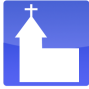
Celebración de Vida