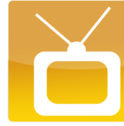
Radio y Televisión